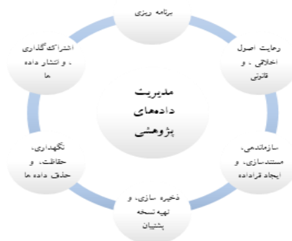
شکل ۱- فرایند مدیریت داده‌های پژوهشی (Research Data Policy, 2019)

سالیانه پژوهش‌های مختلفی در سطح بین‌المللی در قالب فرایند پژوهشی و بر پایه داده‌های پژوهشی معتبر انجام می‌شود. داده پژوهشی هر چیزی است که بر پایه حقایق ۱ ، شواهد، و سابقه واقعی ۲ ، و در جریان پژوهش پژوهشگران به صورت نتایج آزمایش‌ها ۳ ، نتایج حاصل از برنامه‌های نرم‌افزاری، فایل‌های صوتی و رونوشت‌های حاصل از مصاحبه ۴ ، پاسخ‌های پرسش‌نامه ۵ ، عکس، و یا به دیگر صورت‌های ممکن و در قالب‌های متفاوتی همچون اسناد، جدول‌های گسترده، دفترچه یادداشت آزمایشگاهی ۶ ، یادداشت‌های روزانه ۷ ، پایگاه‌های اطلاعاتی، وبسایت‌ها، الگوها، الگوریتم‌ها، نمونه‌ها، و یا دیگر قالب‌ها، تولید، جمع‌آوری، ذخیره‌سازی، و پردازش می‌شود تا به تولید نتایج پژوهش و اعتباربخشی و تأیید آن‌ها منجر شود. در بسیاری از موارد اگر این داده‌ها به درستی مدیریت شوند، اشتراک‌گذاری، استفاده مجدد، ترکیب و بازآفرینی، و کسب ارزش از این داده‌ها امکان‌پذیر خواهد شد. مدیریت داده‌های پژوهشی (شکل ۱) قبل از شروع پژوهش آغاز می‌شود و تا بعد از اتمام پژوهش ادامه می‌یابد و انواع مختلفی از فرایند «مالکیت» جمع‌آوری، ذخیره، حفاظت، نگهداری، تجزیه و تحلیل، به اشتراک‌گذاری، و گزارش داده‌ها را دربر می‌گیرد.