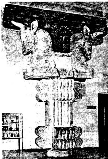
شکل ۱. نمونه تصویر بازیابی شده از موزه لوور پاریس مربوط به ستون کاخ داریوش اول (آبادانا)

فرامتنی به موزه‌های مختلف جهان است. برای مثال، با انتخاب ۱ می‌توان به فهرست الفبایی ۶۵ کشور مختلف که دارای سایت وب مشخصی برای موزه‌های خود هستند، دسترسی پیدا کرد. فرض کنید می‌خواهید از آثار و اشیای مرتبط با فرهنگ و تمدن ایران باستان که در سایت وب موزه لوور ۲ پاریس (۸) موجود است، آگاهی حاصل کنید. با انتخاب کشور فرانسه در فهرست الفبایی نام کشورها و انتخاب عنوان موزه لوور، به راحتی می‌توانید به این موزه برجسته راه پیدا کنید. امکانات مختلفی نظیر مشاهده برخی از نقاشی‌های برجسته (نظیر مونالیزا) ۳ دسترسی به اسناد و اشیای تاریخی موجود در موزه مربوط به تمدن‌های مصر، یونان، گردش مجازی در موزه و نیز بازدید مجازی نمایشگاه‌های جاری در نظیر گرفته شده است. در این میان، در مجموعه آثار باستانی مشرق زمین و هنرهای اسلامی، مدخلی به ایران اختصاص داده شده است و تصاویر و توصیف برخی از اشیای باستانی ایران وجود دارد (شکل ۱). یکی دیگر از منابع دسترسی به اطلاعات موزه‌ها، منابع موزه (۸) نام دارد که امکان دسترسی جامع به موزه‌های پیوسته در سراسر جهان را براساس تقسیم جغرافیایی نام قاره‌ها می‌دهد.