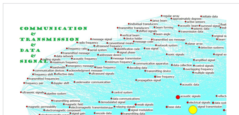
شکل ۳. بخشی از شبکه هم‌رخدادی واژگان پروانه‌های ثبت اختراع براساس مرکزیت بینابینی

از طرفی، شبکه خصوصی هریک از اصطلاحات پراهمیت این حوزه که در شکل ۱ نشان داده شده است، به‌طور جداگانه بررسی شد. کانون توجه، واژه‌هایی بود که حضور بیشتری در اصطلاحات آن شبکه داشتند. به این ترتیب، زیرمجموعه‌های هریک از این اصطلاحات مهم نیز به‌دست آمد. به‌طور نمونه و برای رعایت اختصار، قسمتی از شبکه خصوصی یکی از مرکزترین موضوعات (انتقال سیگنال) ۱ در شکل ۲ نشان داده شده و مشخص می‌شود که با چه موضوعاتی مستقیماً در ارتباط است. ۲ در هر بخش، واژه‌هایی که به‌صورت ضخیم آورده شده‌اند، آنهایی هستند که تکرار حضورشان در اصطلاحات آن بخش بالاست. به‌منظور اختصار، از آوردن تمامی نقشه‌ها خودداری شده است، اما هر موضوع مرکزی همراه با واژه‌های مهم اصطلاحات آن در جدول ۱ آمده است.