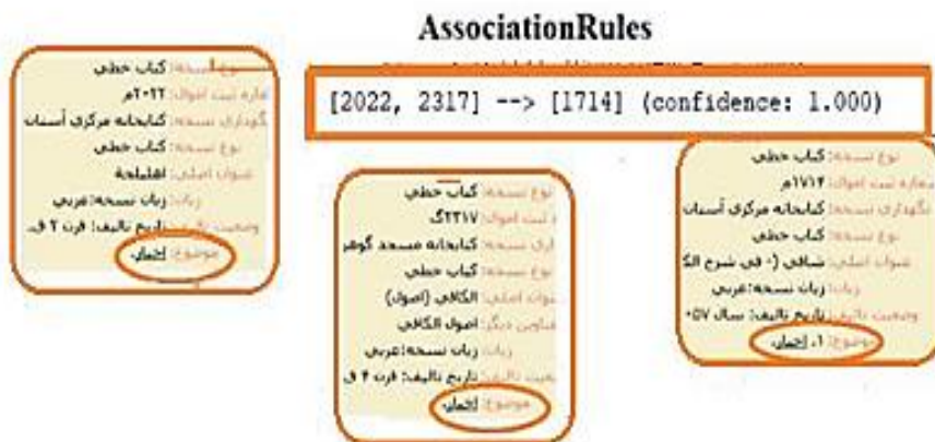
شکل ۳- نمایی از قوانین ایجاد شده و مطابقت آن با موضوع اخبار