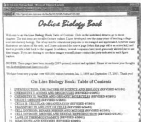
شکل ۲. نمونه فهرست مندرجات یک کتاب الکترونیکی منحصر به فرد که فقط در قالب دیجیتال منتشر شده است

کتاب‌های الکترونیکی را می‌توان به دو صورت در محیط وب شناسایی کرد. برخی کتاب‌های الکترونیکی، شکل چاپی ندارند و فقط در قالب دیجیتال منتشر می‌شوند. همه فرایند نشر کتاب از زمان تألیف تا قرار گرفتن در محیط وب، به صورت الکترونیکی انجام می‌شود. بنابراین، چنین کتاب‌هایی را نمی‌توان در جهان چاپی و کتابخانه‌های سنتی یافت و از این لحاظ اثری منحصر به فرد به شمار می‌آیند. این بخش از عرصه نشر کتاب‌های الکترونیکی هنوز با مشکلات حقوقی، معنوی و اقتصادی روبه‌رو است (شکل ۲).