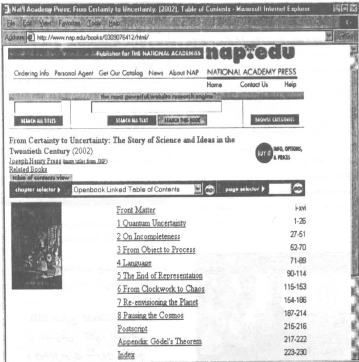
شکل ۶. امکان جست و جو در متن کامل، یک فصل یا صفحه مشخص از یک کتاب الکترونیکی در سایت Academic Press National

گرفت. اگرچه، تهیه نمایه چاپی در انتهای کتاب، برای دسترسی به موضوعات مورد نظر بسیار ارزشمند است؛ ولی تهیه نمایه مناسب و کارآمد (نمایه نام اشخاص، نمایه موضوعی و جز آن) نیاز به صرف هزینه از سوی ناشر و بهره گیری از نمایه سازان متخصص و حرفه ای دارد.