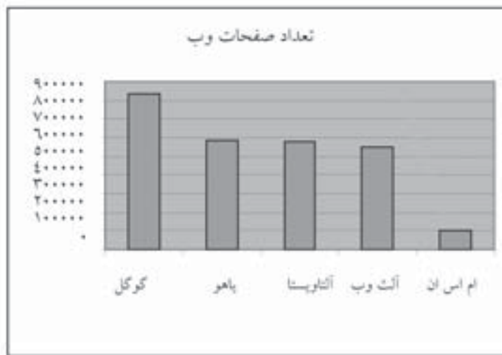
نمودار ۱. مقایسه موتورهای کاوش

domain:ir/ NOT (domain:ac.ir/ OR domain:gov.ir/ OR domain:org.ir/ OR domain:co.ir/ OR domain:net.ir/ OR domain:sch.ir/ OR domain:id.ir/)