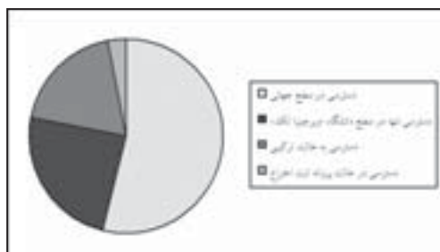
نمودار ۳. قابلیت دسترسی به پارسا در دانشگاه ویرجینیا تک.

می‌شود، تفاوت در نگرش افراد نسبت به مسئله حفاظت و روش‌های آن با توجه به پیدایش و کاربرد فناوری‌های نوین است. در زمینه سطح دسترسی به پایان‌نامه‌ها و رساله‌ها از طریق پارسا و حقوق پدیدآورنده این منابع دیدگاه‌های گوناگونی وجود دارد. در حالی که تعدادی از این مدارک به‌طور کامل در دسترس همگان قرار دارند، دسترسی به پاره‌ای دیگر با محدودیت همراه است. حالت سومی نیز به نام «حالت ترکیبی» ۱۴ وجود دارد که در آن، دسترسی به برخی قسمت‌های یک مدرک الکترونیکی (مانند فصل‌های خاص یا فایل‌های چندرسانه‌ای) محدودیت دارد، در حالی که دسترسی به دیگر قسمت‌های همان متن آزاد است. در دانشگاه ویرجینیا در سال ۲۰۰۰ امکان دسترسی به ۵۴ درصد پارساها برای همگان در سراسر دنیا وجود داشت، دسترسی به ۱۹ درصد این منابع حالت ترکیبی داشت، و ۲۴ درصد باقی‌مانده به‌طور محدود و تنها در داخل دانشگاه ویرجینیا قابل استفاده بودند (نمودار ۳).