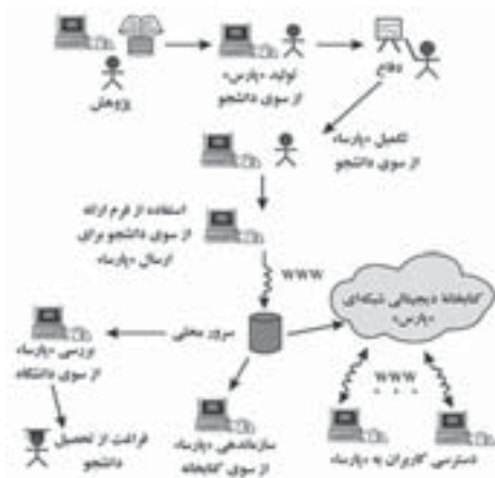
نمودار ۱. چرخه حیات پارسی (۱۱: ۳۵)

کارهای دیگران دسترسی یابند و از انجام پژوهش‌های تکراری پرهیز کنند؛