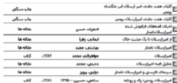
تصویر شماره ۲. ویرایش ۳۶ صفحه‌ای خلاصه شده از امیر ارسلان که در صفحه اول نمایش نتایج وجود دارد.

اما آیا زمان کاربر، اجازه مرور ۸۲۹ مدرک بازیابی شده را در جستجوی «مولوی» و