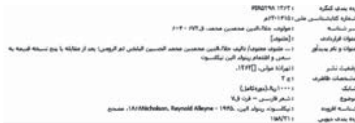
تصویر شماره ۳. پیشینه مربوط به نسخه تصحیحی نیکلسون که در یازدهمین صفحه از پیشینه‌های بازیابی شده، قابل دسترسی است.