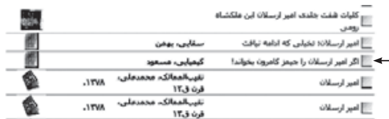
تصویر شماره ۱. مورد نشان داده شده، مقاله‌ای است که اصولاً در پیوند مستقیم با محتوای داستانی امیرارسلان نیست.

مسلم است در چنین شرایطی ارائه امکان جستجوی کلیدواژه‌ای «امیرارسلان نامدار»، مانند آنچه بی و لین نیز اشاره کرده‌اند، چندان نمی‌تواند راهگشا باشد (۴۲: ۴۵). چراکه به‌عنوان نمونه با جستجوی کلیدواژه‌ای این عبارت در نمایه عنوان فهرست پیوسته سازمان اسناد و کتابخانه ملی، تنها مدارکی بازیابی می‌شود که کلیدواژه‌های «امیرارسلان» و «نامدار» را در عنوان خود داشته باشد. البته گفتنی است که با جستجوی عنوان قراردادی نیز، تمام پیشینه‌های مرتبط بازیابی نمی‌شود. زیرا برخی از پیشینه‌ها به‌واسطه خطای انسانی به‌صورت جداگانه ذخیره شده است و گذشته از چنین خطایی، مدارکی هستند که احتمالاً برای کاربر کاملاً بی‌معنا خواهد بود (تصویر شماره ۱).