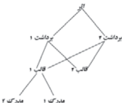
تصویر شماره ۸، نمودار ابتدائی انطباق موجودیت‌های الگوی ملزومات کارکردی پیشینه‌های کتاب‌شناختی بر الگوی طراحی شیء‌گرا