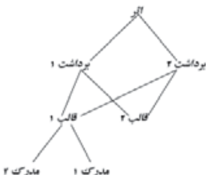
تصویر شماره ۸، نمودار ابتدائی انطباق موجودیت‌های الگوی ملزومات کارکردی پیشینه‌های کتاب‌شناختی بر الگوی طراحی شیء گرا