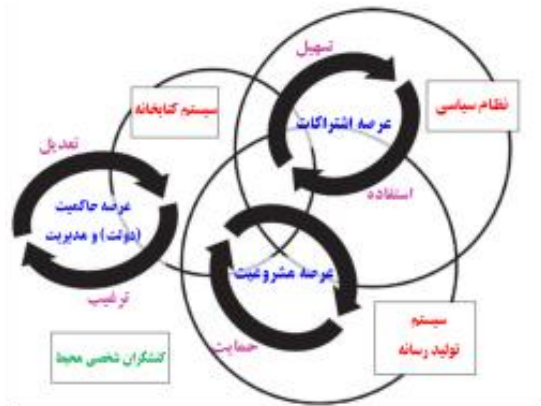
شکل ۲- عرصه‌های حوزه عمومی در کتابخانه‌های عمومی

در شکل ۲ نظام کتابخانه در محیط واقع شده است. محیط از کنشگران، نظام سیاسی و سیستم تولید رسانه تشکیل شده است. این سیستم‌ها تا حدودی با یکدیگر و نیز با کتابخانه هم‌پوشانی و تلاقی دارند. هر یک از این سه عرصه حوزه عمومی در کتابخانه‌های عمومی، با این موجودیت‌های محیطی، به شکل متفاوتی در ارتباط هستند.