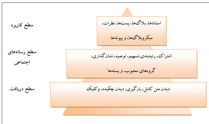
شکل ۱. هرم سطوح مختلف عمق اثرگذاری دگرسنجه‌ها (جانپینگ و هوکیانگ، ۲۰۱۵)

به‌طوری‌که در شکل ۱ دیده می‌شود در مدل ارائه‌شده، قاعده مثلث، «سطح دریافت»؛ طبقه میانی آن، «سطح رسانه اجتماعی»؛ و هرم آن، «سطح کاربرد» ۳ نامیده شده است. تعداد کلیک، بارگیری، مشاهده چکیده، یا متن کامل مقاله، سنجه‌هایی هستند که در دسته نخست قرار می‌گیرند. تعداد پسند، بوکمارک، توصیه، اشتراک سنجه‌های دسته‌بندی‌شده با نام «سطح رسانه اجتماعی»؛ و تعداد لینک‌ها، نظرها، استنادها نیز سنجه‌های متعلق به سطح سوم یعنی «سطح کاربرد» هستند.