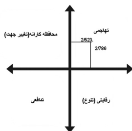
تصویر ۲. نواحی چهارگانه و موقعیت راهبردی اداره کل پردازش و سازماندهی

با توجه به اینکه امتیاز نهایی ارزیابی عوامل خارجی ۲/۷۸۶ یعنی بیش از ۲/۵ حاصل شده است، می توان گفت که فرصت های اداره کل پردازش و سازماندهی بر تهدیدهای آن برتری نسبی دارد. پس از تعیین امتیاز حاصل از ارزیابی هریک از عوامل داخلی و خارجی اداره کل پردازش و سازماندهی، بر روی یک محور مختصات، امتیاز عوامل داخلی بر روی محور افقی و امتیاز عوامل خارجی بر روی محور عمودی مشخص شد. مرکز محور به عدد ۲/۵ اختصاص یافته است. این محور دارای چهار ناحیه است که محل تلاقی امتیازهای نهایی عوامل داخلی و خارجی در هریک از نواحی بیانگر وضعیت راهبردی اداره کل است. تصویر ۲ نواحی چهارگانه وضعیت راهبردی و موقعیت اداره کل پردازش و سازماندهی را نشان می دهد. با توجه به اینکه امتیازهای عوامل داخلی و خارجی از ۲/۵ بیشتر شده است، موقعیت راهبردی اداره کل در ناحیه تهاجمی ارزیابی می شود. به این معنی که اداره کل پردازش می تواند با استفاده از نقاط قوت خود بر نقاط ضعف خود غلبه نموده و از فرصت های پیش رو برای رویارویی و کاهش اثرات تهدیدها استفاده کند.