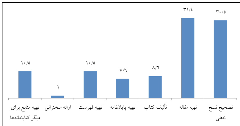
نمودار ۱. هدف از مراجعه به کتابخانه

همان‌طور که نمودار ۱ نشان می‌دهد، ۳۱/۴ درصد از مراجعان هدف خود را از مراجعه به بخش نسخ خطی، تهیه مقاله و ۳۰/۵ درصد تصحیح نسخ خطی اعلام کردند. تهیه فهرست و تهیه منابع برای دیگر کتابخانه‌ها به‌طور مشترک ۱۰/۵ درصد در رتبه‌های بعدی قرار گرفتند. تألیف کتاب با ۸/۶ درصد و تهیه پایان‌نامه با ۷/۶ درصد در رتبه‌های آخر قبل از ارائه سخنرانی با ۱ درصد قرار گرفتند.